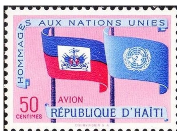
Homenagem à Nações Unidas – Bandeiras do Haiti e da ONU. Emissão postal de 05 de dezembro de 1992

Haiti é um país que era habitado pelos índios aruaques e caraíbas antes da chegada dos europeus. O primeiro navegador europeu a desembarcar na região foi o genovês Cristóvão Colombo, que chegou a ilha Hispaniola (composta pelo Haiti e a República Dominicana) em 05 de dezembro de 1492.