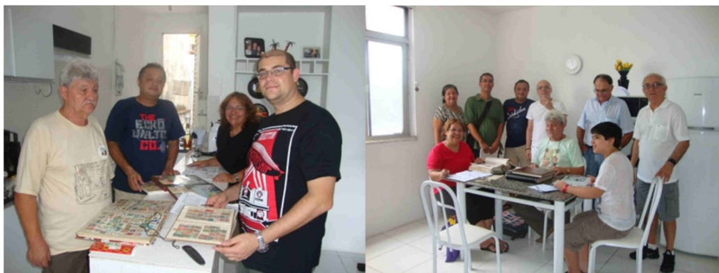
Fotos de nossos encontros na minha casa