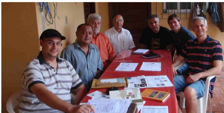
Foto histórica de 2011, primeira reunião na minha casa que culminou com a reativação da SOPHIPA.

Após um longo período que morei em Brasília, e no meu retorno à Belém em 2010, voltei a frequentar a Agência Filatélica dos Correios, onde comecei a reunir os filatelistas, até a reativação da SOPHIPA em 2011, com a sede e reuniões na minha casa. Estamos atuantes nos dias de hoje, e nossos encontros são no Centur Pará e nos Correios.