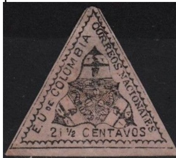
Emissão Postal de 1865

Nessa época, as correspondências não eram entregues nas residências, o que fazia com que as pessoas tivessem de ir buscá-las nos correios. Tanto é que no período de 1865 a 1872 foram emitidos selos triangulares no valor de 2 ½ centavos para pagamento da entrega de correspondências em domicílio.