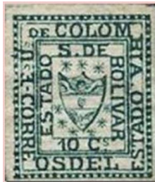
Emissão Postal do Estado de Bolívar de 1863

O destaque destes selos foi o de Bolívar, que foi o pioneiro dentre os estados emissores e que em 1863 fez aqueles que seriam os menores selos do mundo. Os Estados Colombianos foram transformados em departamentos em 1886, quando da criação da República da Colômbia, mas as emissões locais foram autorizadas até 1909.