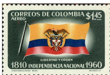
Selo Aéreo – 150 anos da Independência da Colômbia – Bandeira. Emissão de 20 de julho de 1960

A Colômbia é um país que era habitado por tribos indígenas, sendo que os espanhóis Alonso de Ojeda e João da Cosa em 1499 foram os primeiros estrangeiros a pisarem no território.