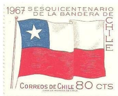
150 Anos da Bandeira Chilena. Emissão de 18 de outubro de 1967

O Chile é um país de cultura pré-colombiana que foi colonizado pelos espanhóis, que chegaram ao território por volta de 1520.