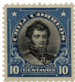
Série Personalidades – Bernardo O'Higgins. Emissão Postal de 19 de setembro de 1911

Sua independência foi conquistada em 12 de fevereiro de 1818, tendo sido alcançada graças a nomes como José de San Martín e Bernardo O'Higgins.