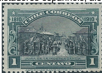
Série Centenário da Independência – Promessa da Independência

Outra exceção à regra dos selos de “Colombo” foram as emissões de Selos Telegráficos de 1904, que traziam a imagem do brasão de armas do país e a efígie de Pedro de Valdivia, um dos conquistadores espanhóis, além da sobrecarga “Correos”.