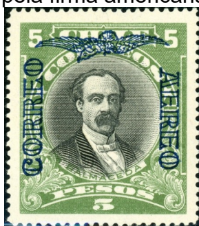
Emissão Postal Aérea – Jose Manuel Balmaceda

Exatamente um ano depois foi a vez da Série Personalidades, com mais de vinte selos, trazendo importantes figuras políticas como Domingo Santa María (ex-presidente chileno) e também personagens ligados à independência. Em comum com a série anterior, os selos foram impressos pela firma americana “American Bank Note Company”.