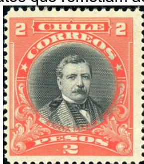
Série Personalidades – Domingo Santa María

Em 18 de setembro de 1910 surgiu a primeira série definitiva que não apresentava a imagem de Colombo. Denominada “Centenário da Independência”, o conjunto de 15 selos mostrava personalidades e fatos que remetiam ao processo de libertação do país.