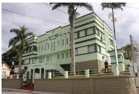
Sede do Tiro de Guerra de Brusque

O Tiro de Guerra 05-005, sediado em Brusque - Santa Catarina, lançou uma bonita medalha comemorativa alusiva ao centenário de sua fundação. Fundado em 8 de dezembro de 1916 sob a denominação “Tiro de Guerra 317”, é uma instituição pertencente ao Exército Brasileiro e está subordinado a 5ª Região Militar, em Curitiba – PR, sendo mantido pela Administração Municipal.