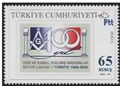
GRANDE LOJA DA TURQUIA Centenário de fundação Emissão: 2009

A Turquia tem seu território dividido entre dois continentes, ou seja, 3,33% fica na Europa e 96,7% fica na Ásia. Durante mil anos a Turquia foi o sustentáculo do império Bizantino e por quase quinhentos anos o centro do império Otomano. Ancara é a capital, com 3,5 milhões de habitantes (2004) e Istambul (antiga Constantinopla, antes Bizâncio) a cidade mais populosa, com cerca de 9,7 milhões de habitantes. Persas, macedônios e romanos passaram pela Turquia.