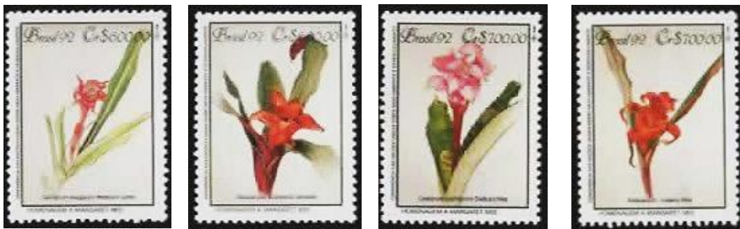
Emissão postal em homenagem à Preservação da Mata Atlântica - 1992 Esquerda/direita: Canistrum exiguum , Nidularium innocentii , Canistrum cyathiforme , Nidularium .