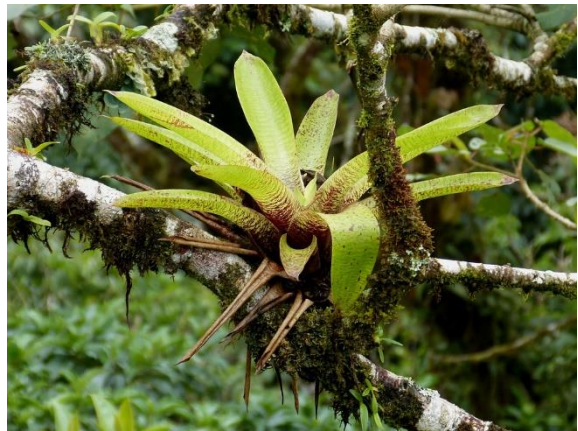
Epiphytic bromeliad in its natural habitat

The great family [Bromeliaceae] gathers “more than 50 genres with around 3 thousand species in the total”. Brazil, which has one of the richest ecosystems in the world, is home to more than 1,500 of these species.