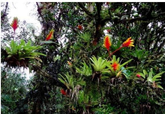
Epiphytic bromeliads found in the Atlantic Forest (Mata Atlântica)

The denomination bromeliad is attributed to the French monk and explorer Charles Plumier (1646-1704), that on duty of King Louis XIV of France was in the Antilles between 1689 and 1695 when he found a species of plant that the native would name “Karatas”. Plumier named them bromeliads as a tribute to the Swedish botanist Olof Bromelius (1639-1705). As epiphytic plants, the bromeliads are “guests” of other plants, that means, they use them only as a fixation element without removing their nutrients.