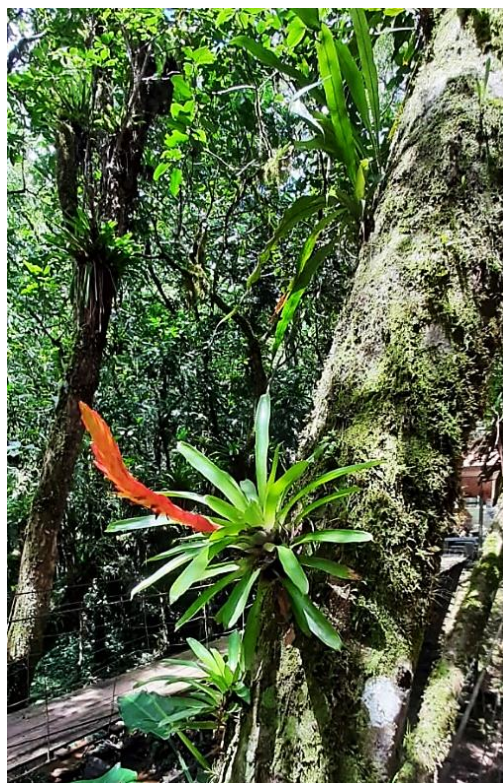
Vriesea Incurvata – Gravatá Epífita encontrado nas matas do Parque Municipal das Grutas de Botuverá – SC

Amplamente cultivado pelos povos nativos da América Central e Caribe, o abacaxi foi introduzido na Europa como prova da exuberância das terras do Novo Mundo.