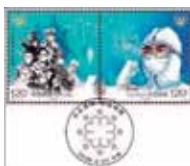
Sellos chinos conmemorativos de la lucha contra el COVID-19

Y frente al encierro de las masas es evidente que comienzan las consecuencias, uno a uno los diversos giros de la economía han comenzado a flaquear, incluso a colapsar: restaurantes, bares, centros comerciales, cines, parques de diversiones, todos se encuentran cerrados. Algunos han tenido la ventaja de poder trabajar desde casa, aprovechando las bondades tecnológicas que hoy abundan, pero el grueso de la población, al menos en países en vías de desarrollo (como el nuestro), no tiene otra opción sino seguir arriesgando su salud y saliendo a buscar el pan de cada día.