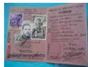
Ejemplos de cartillas de identidad postal de Italia (1938), Alemania (1943) y España (1961)

En las regulaciones emanadas del segundo protocolo adicional a la constitución de la UPU en 1974, se establecieron lineamientos para la emisión de la cartilla de identidad postal que son