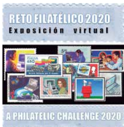
Imagen promocional del Reto filatélico 2020: Exposición virtual

Los filatelistas de antaño no nos estamos quedando atrás en la perpetuación de nuestra afición y ya son varias las iniciativas lanzadas a través de medios electrónicos para mantener actividades que permitan el contacto entre coleccionistas y la difusión continua de la filatelia. Estas actividades manifiestan la disposición de numerosos compañeros a continuar con su afición aún en los tiempos más difíciles y, así mismo, nos dejarán bellas postales y anécdotas para la posteridad.