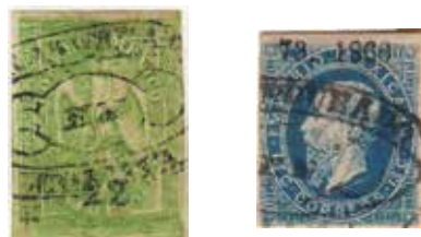
Sub-distrito COLIMA: “Águilas” y “Maximilianos”, todos los timbres están sin nombre de sub-distrito