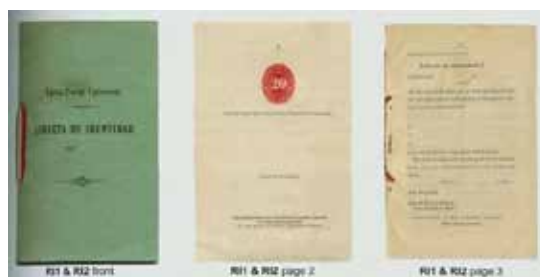
Libreta de identidad postal. México 1888

En el interior de la libreta se encontraba una cuponera de 10 o 20 cupones. Dichos cupones eran desprendidos de la libreta y entregados al cartero cuando se recibía correspondencia registrada o un giro postal. Estas libretas tenían una vigencia de un año. Instrucciones de uso en varios idiomas completaban la libreta. Se recomienda consultar el catálogo de papelería postal de MEPSI.