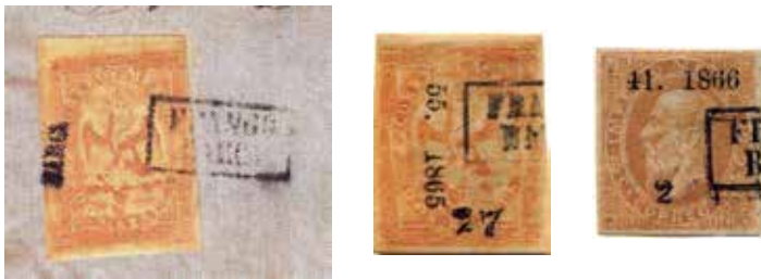
Sub-distrito BARCA: "Águilas" con y sin nombre. "Maximiliano" 25¢ sin nombre, sub-consignación #26-1866, único envío a Barca de Maxis