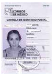
Cartilla de identidad postal. México

En el interior de la libreta se encontraba una cuponera de 10 o 20 cupones. Dichos cupones eran desprendidos de la libreta y entregados al cartero cuando se recibía correspondencia registrada o un giro postal. Estas libretas tenían una vigencia de un año. Instrucciones de uso en varios idiomas completaban la libreta. Se recomienda consultar el catálogo de papelería postal de MEPSI.