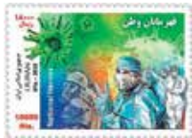
Irán fue el primer país en emitir una estampilla relacionada con la pandemia del COVID-19

A pesar de tener una tasa relativamente baja de decesos por total de casos (se habla de entre un 5% y un 10%), la facilidad con la que se contagia este virus ha permitido que se difunda como reguero de pólvora, evidenciando lo poco o nada preparados que estábamos para hacer frente a un fenómeno de semejante magnitud. Su presencia ha venido a distorsionar gravemente las actividades humanas, derivando inevitablemente en un colapso económico que apenas comenzamos a dimensionar en impacto y duración.