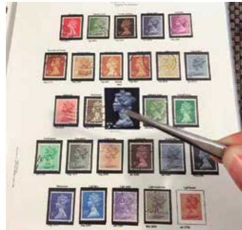
La filatelia es un pasatiempo muy “intragameable”

Un efecto poco esperado de esta situación de encierro ha sido un nuevo florecimiento en las aficiones cotidianas, el hastío y la falta de contacto social exigen que el humano encuentre nuevas formas de esparcimiento. Así es como hemos podido apreciar un innegable “boom” en actividades como la repostería, las rutinas de ejercicio y, desde luego, el coleccionismo. La filatelia no ha sido la excepción a estas tendencias, toda vez que los filatelistas tenemos súbitamente mucho más tiempo disponible para dedicar a nuestras colecciones, simultáneamente se han atraído a nuevos adeptos que miran con curiosidad el coleccionismo de estampillas postales.