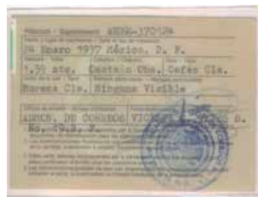
Cartilla de identidad postal fechada 28 de junio de 1989, con validez de 1 año y pagada con dos timbres de la serie México Exporta por un total de 2,700 pesos. El primero de ellos CINE, con valor facial 700 pesos, del papel 10. El segundo HIERRO FORJADO, con valor facial de 2,000 pesos del papel 9