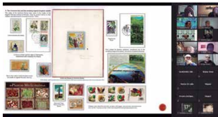
Capturas de pantalla de las reuniones virtuales de Mi Oficina , mismas que muestran la riqueza de las conferencias que en ellas se están dictando

A ello hay que agregar una asistencia muy alta, diariamente se están conectando en promedio de sesenta miembros de varias nacionalidades, especialmente de Latinoamérica, pero también de otros países más distantes como Hong Kong. Las conferencias se dictan en español, pero ya se están probando mecanismos de traducción simultánea a otras lenguas, esto con la finalidad de continuar internacionalizando y creciendo el foro.