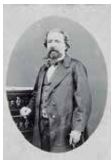
Ejército francés entrando en Guadalajara en enero 1864. Generales Rómulo Díaz de la Vega (cons.) y José María Arteaga (lib.). General francés Félix Charles Douey