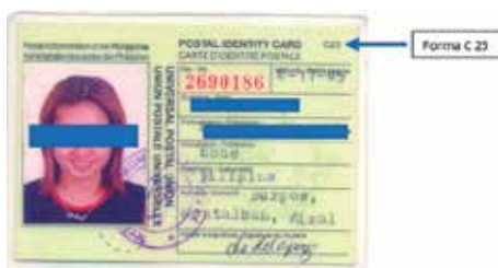
Cartilla de identidad postal. Filipinas. Agosto 2004. Forma C 25