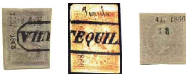
Sub-distrito TEQUILA: "Águila" de medio real sin nombre sub-consig. #45-1865. El único timbre conocido con nombre manuscrito. Sólo hubo un envío de "Maximilianos" a Tequila, la sub-consig. #23-1866, prácticamente todos los conocidos son remanentes sin usar.