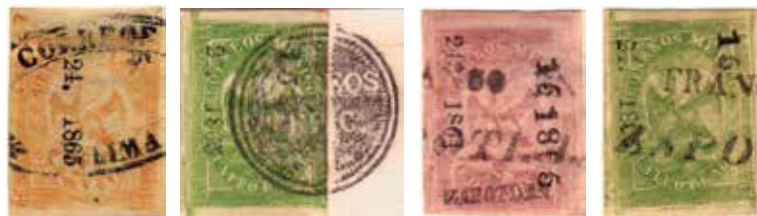
Ejemplos de la sub-consignación #15-(1865) enviados a diferentes oficinas sub-distritales, entre ellas: Colima, Tepic, Zapotlán. El timbre de medio real con nombre Zapotlán porta un número de sub-consignación que incluye el año (muy pocos timbres sub-consignados lo incluyen). Ese envío incluyó: 300 timbres de medio real de la consignación #243-1864 enviados a Zapotlán con la sub-consignación #15-(1865), dos terceras partes de ellos muestran el nombre del sub-distrito según Pietsch.

La sub-consignación #15-(1865) nos da una pista valiosa sobre cómo fueron manejados los envíos de timbres a sub-oficinas en este lapso. Existen ejemplos que sobreviven de esta sub-consignación con y sin sellos validadores destinados a Cocola, Colima, Tepic, Zapotlán y Guadalajara (envío a Zacoalco).