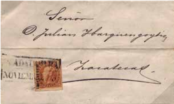
Carta de Guadalajara a León con fecha del 29 de mayo de 1864. Carta enviada de Guadalajara a Zacatecas el 8 de noviembre de 1866 franqueada con un timbre de la última consignación (#109)