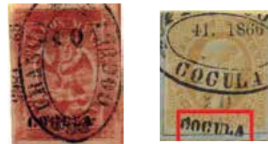
Sub-distrito COCULA: Águila de 8 reales con nombre, sub-consignación #40-1865. “Maximiliano” 25¢ con nombre, sub-cons. #20-1866