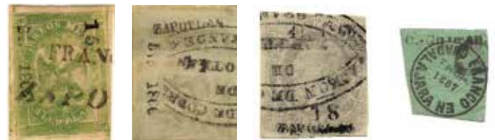
Sub-distrito ZAPOTLÁN: “Águilas” sin y con nombre. “Maximiliano” 7¢ con nombre, sub-consignación #18-1866. Zapotlán, ahora renombrada Ciudad Guzmán, continuó la práctica de poner su nombre a los timbres tras la restauración. Sólo lo hizo brevemente a principios de 1867 y pronto discontinuó su uso cuando las autoridades republicanas eliminaron los sub-distritos postales.