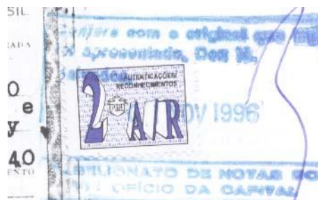
Algarismo 2 roxo