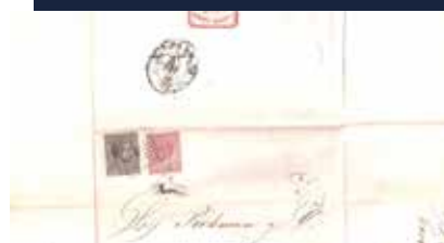
Carta anterior abierta. Se ve el destinatario, el remitente a la derecha y la etiqueta rota.