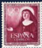
Título: XXXV Congreso Eucarístico Internacional en Barcelona Santa María Micaela