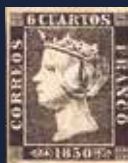
Título: Primer sello emitido en España Isabel II 6 cuartos