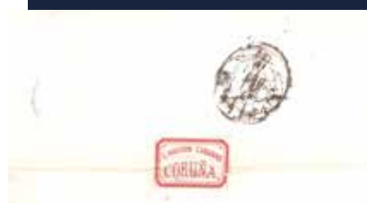
Carta circulada en 1878 de Coruña a Sevilla con etiqueta de cierre y sellos de Alfonso XII (números. 168 y 192 del catálogo de Edifil).