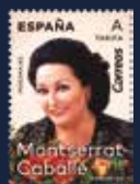
Título: PERSONAJES. Montserrat Caballé