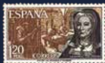
Título: Personajes españoles. Beatriz Galindo.