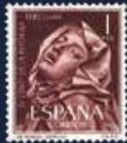
Título: IV centenario de la reforma teresiana. Santa Teresa de Jesús. Escultura de Bernini