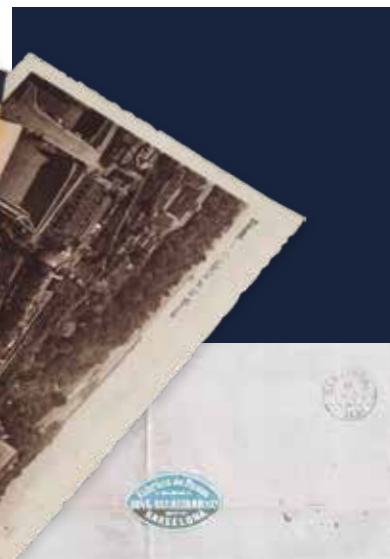
Carta en 1867 de Barcelona a Zaragoza franqueada con etiqueta de cierre y sello de Isabel II (núm. 96 del catálogo de Edifil).

Pensamos que tampoco podemos considerarlas como viñetas aunque si podemos suponer que son un precedente de las mismas dado que posteriormente la normativa obligará a pegarlas en el mismo lugar o sea el anverso del sobre y la viñeta recuperará e incrementará el sentido publicitario que tenía la etiqueta de cierre.