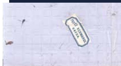
Carta en 1864 de Úbeda a Granada franqueada con etiqueta de cierre y sello de Isabel II (núm. 64 del catálogo de Edifi