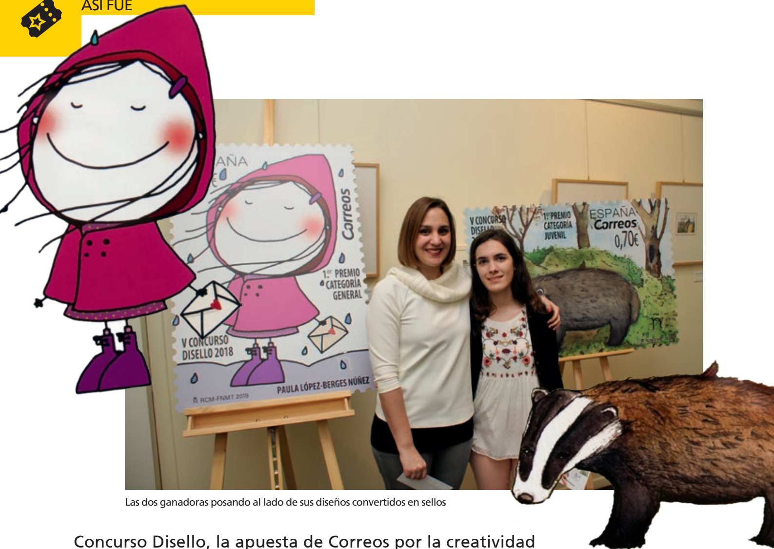
Las dos ganadoras posando al lado de sus diseños convertidos en sellos

Concurso Disello, la apuesta de Correos por la creatividad