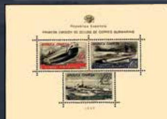
Hoja bloque de Correo Submarino emitida el 11 de agosto de 1938.