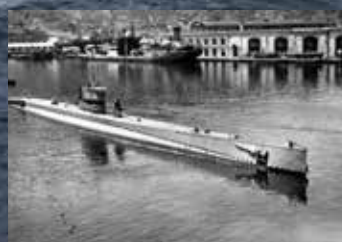
Submarino C-4, que efectuó el correo.