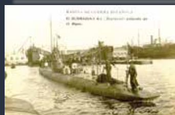
Submarino A-1 (Monturiol). (Tarjeta Postal colección Marcelino González).