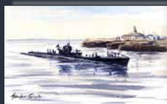
Submarino D-1. (Acuarela por Marcelino González).