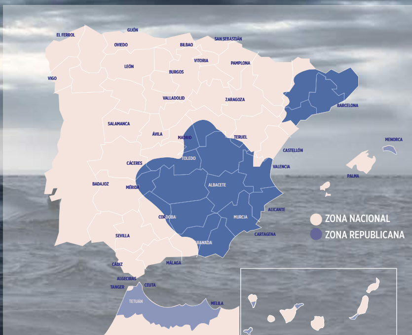
Situación de España en julio de 1938. (Composición por Marcelino González).