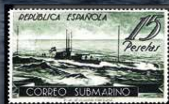
Submarino D-1, en un sello de 15 pesetas de Correo Submarino.