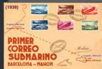
Derrotas y horas de salida y llegada del submarino C-4, en sus viajes de ida y vuelta como correo. (Composición por Marcelino González a partir de una ilustración de época).