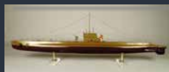
Modelo de un submarino de la clase "B". (Museo Naval de Madrid)