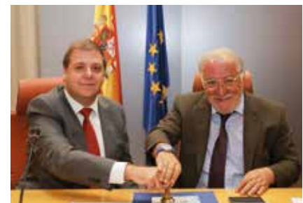
Juan Manuel Serrano y Pere Navarro

Correos presentó el sello que conmemora el 60 aniversario de la Dirección General de Tráfico (DGT), con la asistencia del director general de Tráfico, Pere Navarro, y el presidente de Correos, Juan Manuel Serrano. Pere Navarro consideró este reconocimiento como "algo que es más una marca que un organismo. Y lo mismo ocurre con la Agrupación de Tráfico de la Guardia Civil". "La historia de la DGT –señaló Navarro– va vinculada a la industria del automóvil, el gran protagonista del siglo XX".