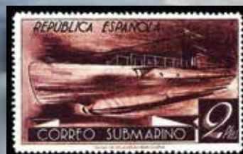
Submarino A-1 (Monturiol), en un sello de 2 pesetas de Correo Submarino.