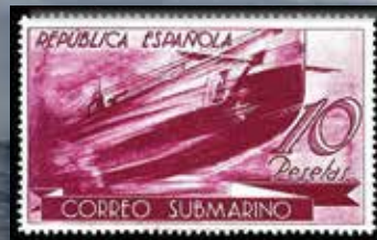
Submarino B-2, en un sello de 10 pesetas de Correo Submarino.