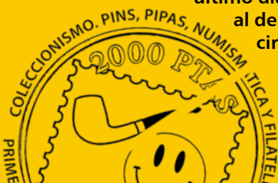
Imagen de matasellos inutilizado

(*) Correos y telégrafos, S.A. Filatelia 5ª planta/ c/ Hiedra s/n. 28070 MADRID.