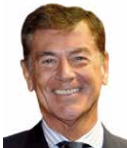
José Ramón Moreno Fernández-Fígares Presidente de la Federación Europea de Asociaciones Filatélicas (FEPA)

La Federación Europea de Sociedades Filatélicas (FEPA), agrupa a las 43 Federaciones Nacionales de Europa y sus 5.200 Sociedades y Grupos Filatélicos, con 325.000 filatelistas asociados.