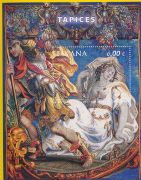
Tapices. Matrona y guerrero en una barca, s. XVII

Marzo Centenario de la Real y Militar Orden de San Fernando