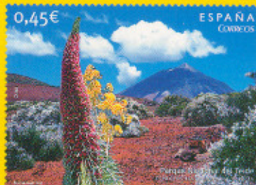
Parque Nacional del Teide