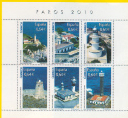
Hoja Bloque de 6 sellos: 115,2 x 105,8 mm Sellos: 28,8 x 40,9 mm