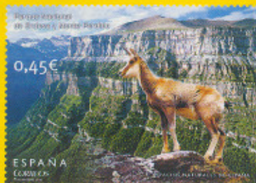
Parque Nacional de Ordesa y Monte Perdido