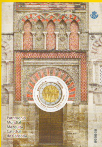
Hoja Bloque de 1 sello: 104,5 x 150 mm Sello circular: 33,2 mm de diámetro Mezquita-Catedral de Córdoba