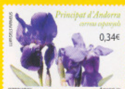
40,9 x 28,8 mm Liri dels Pirineus