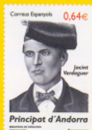
28,8 x 40,9 mm Jacint Verdaguer