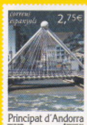
28,8 x 40,9 mm Pont de París