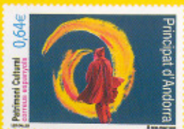
40,9 x 28,8 mm Les Falles