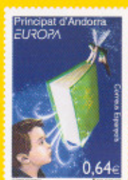
28,8 x 40,9 mm Llibres Infantils