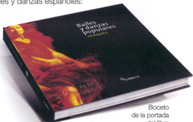
Boceto de la portada del libro

las sevillanas la isa el bolero la mateixa la rueda el aurresku la muñeira el fandango el candil las seguidillas la jota la sardana