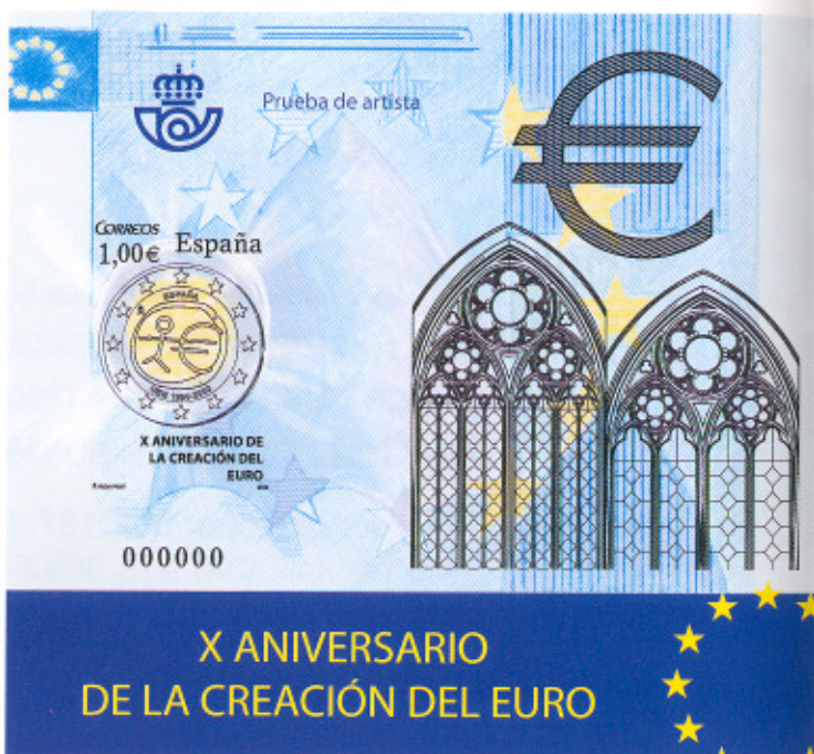
Prueba «X Aniversario de la creación del Euro»

Previo a la impresión calcográfica es necesario que un grabador de la FMNT grave a buril sobre una plancha la parte calcográfica.