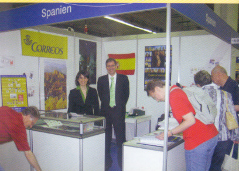
Correos en la XVII Feria de Filatelia Internacional en Essen (Alemania). Abril 2007.