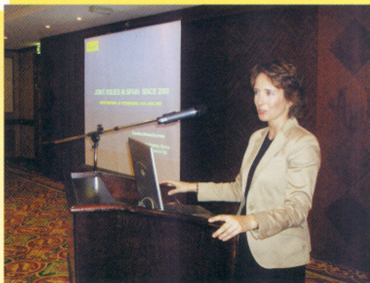
Sesión del Foro «Emisiones conjuntas. Innovación en el negocio de sellos». Junio 2007.