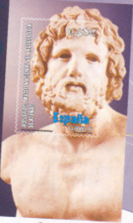
Bocato sujeto a cambios

Α Β Γ Δ Ε Ζ Η Θ Ι Κ Λ Μ Ν Ξ Ο Π Ρ Σ Τ Υ Φ Χ Ψ Ω ESPAÑA Δ Ε Ρ Ο Ω Μ Ο Ω Χ Ψ Ω GRECIA