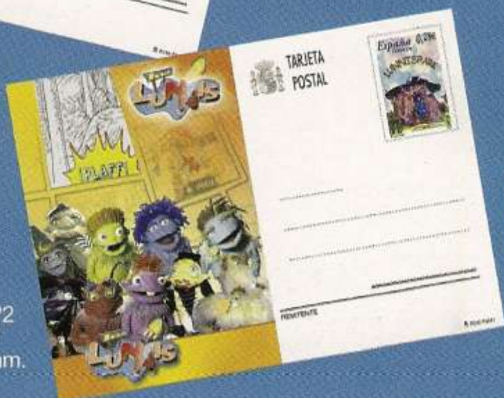
Los Lunnis nº2 "La tierra de los Lunnis" Cuatricromía, 148,5x105 mm.