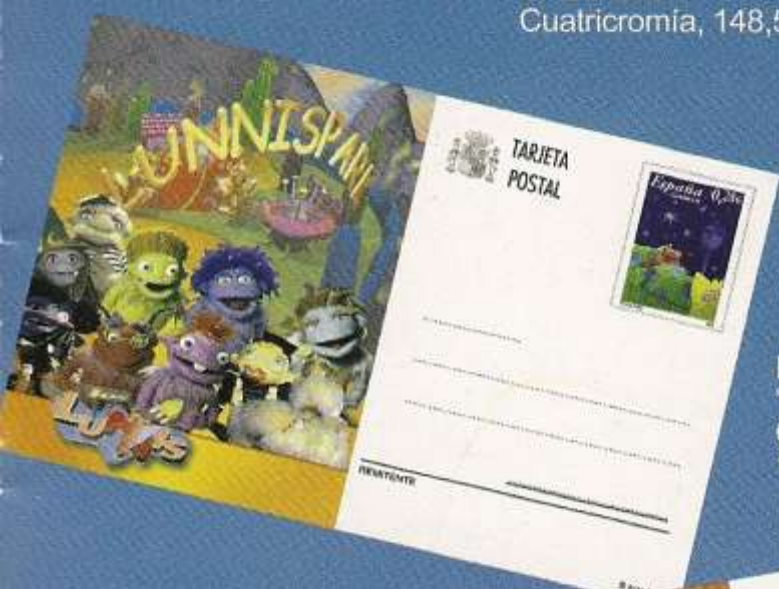
Los Lunnis nº1 "Lunnispark" Cuatricromía, 148,5x105 mm.