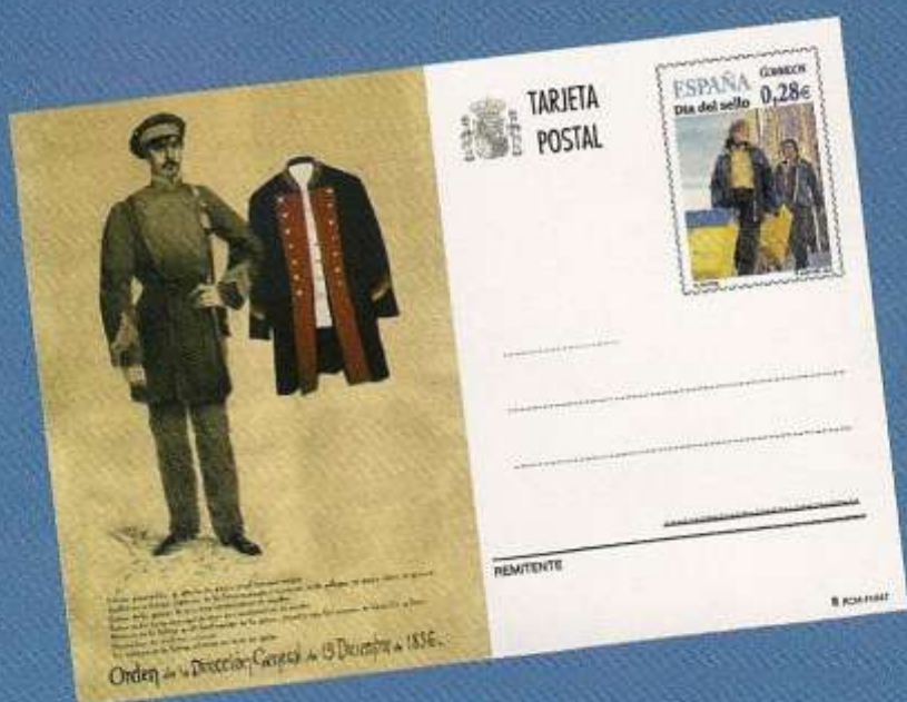
El Cartero Cuatricromía, 148,5x105 mm.

Correos te ofrece la posibilidad de abonarte o adquirir estas nuevas Tarjetas entero postales.